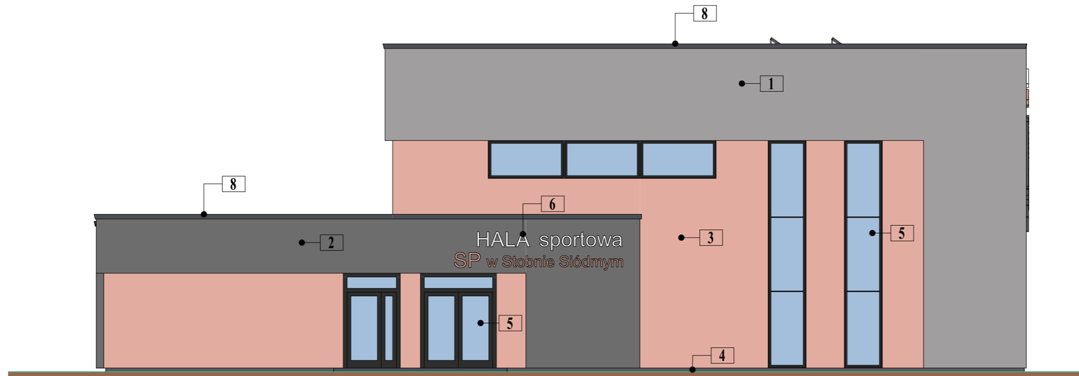
ELEWACJA POŁUDNIOWA - TYLNA